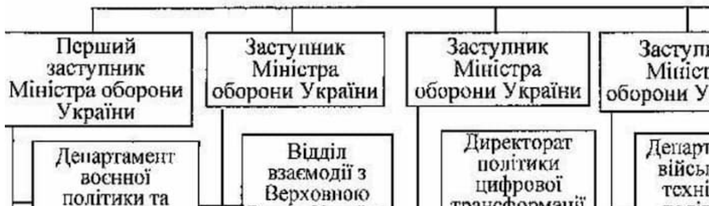
Схема спрямування та координації діяльності структурних підрозділів апарату Міністерства оборони України