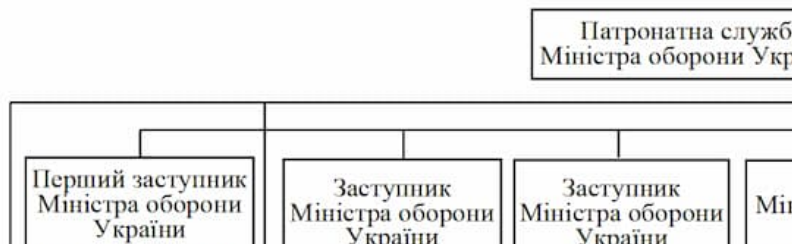
Схема спрямування та координації діяльності самостійних структурних підрозділів апарату Міністерства оборони України

до наказу Міністерства оборони України 03.11.2023 № 663 (у редакції наказу Міністерства оборони України № 760)