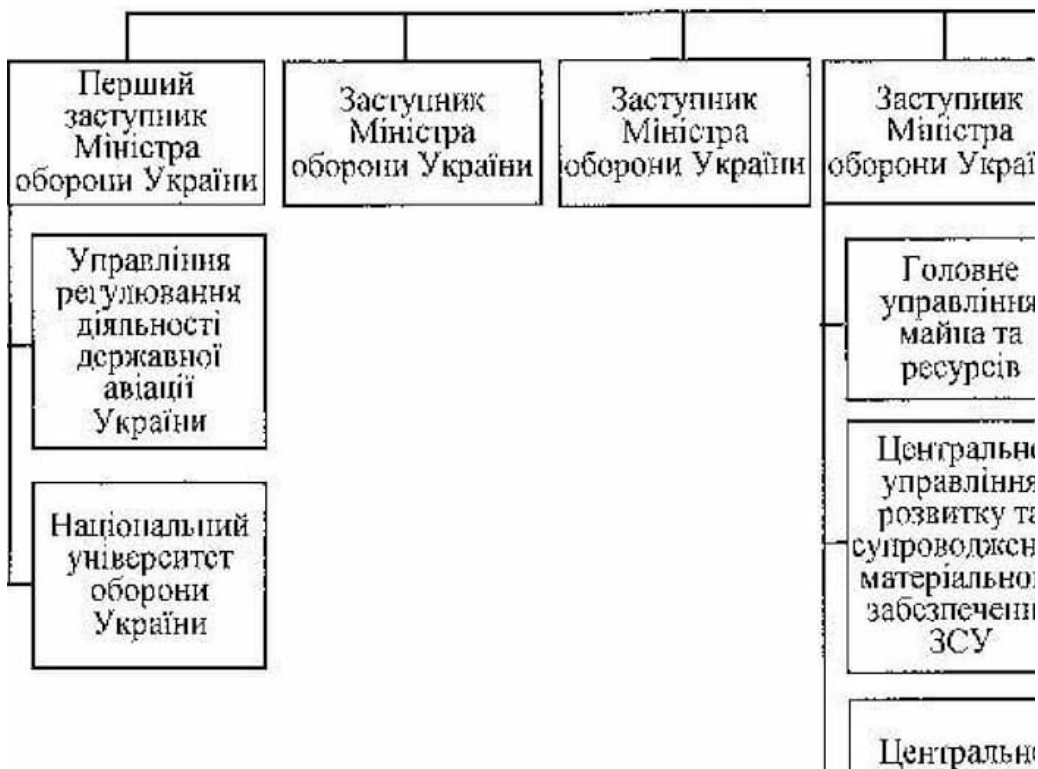
Схема керівництва Збройними Силами України, спрямування та координації діяльності Державної спеціальної служби транспорту, органів військового управління, військових частин, вищих військових навчальних закладів, установ, безпосередньо підпорядкованих Міністерству оборони України

Наказ Міністерства оборони України від 22 вересня 2020 року № 346 (у редакції наказу Міністерства оборони України від 20 січня 2022 року №22)