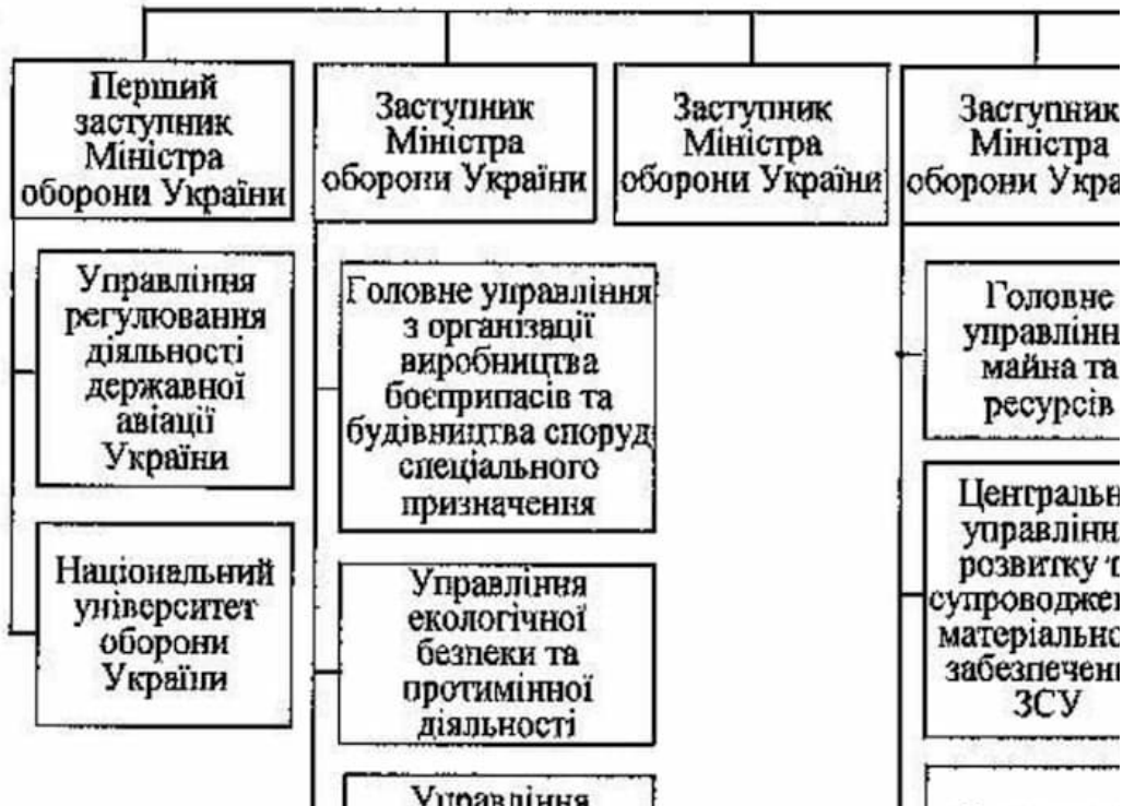
Схема керівництва Збройними Силами України, спрямування та координації діяльності Державної спеціальної служби транспорту, органів військового управління, військових частин, вищих військових навчальних закладів, установ, безпосередньо підпорядкованих Міністерству оборони України